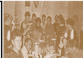
Večera spremljena na afrički način

Uzvratna posjeta gornjevukufskom KUD-u Francuski humanitarci donijeli pomoć