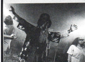
Le premier festival s'est tenu en août 1999.

Du 25 au 30 août prochain se tiendra à Tuzla (Bosnie-Herzégovine) la deuxième édition d'un festival organisé à l'initiative d'Emmaüs International. Des jeunes venus des pays environnants et de divers Etats européens pourront échanger sur des initiatives sociales ou économiques réussies, au cours de différents ateliers. Objectif : dialoguer pour rétablir la paix et construire de nouveaux liens, dans cette région de l'Europe exposée à de graves conflits depuis 10 ans, où le système économique et social est profondément perturbé. Un volet festif et ouvert à un plus large public réunira chaque soir des musiciens pour une série de concerts. La Fondation Abbé Pierre accompagne cette initiative en soutenant financièrement le volet culturel de la manifestation.