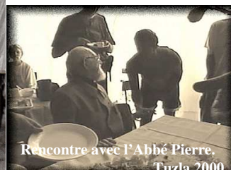
Rencontre avec l'Abbé Pierre. Tuzla 2000

Uzvratna posjeta gornjevukufskom KUD-u Francuski humanitarci donijeli pomoć